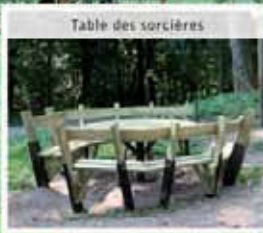
Table des sorcières