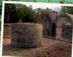
Château du Warthenberg